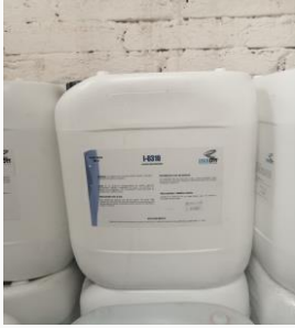
I-0310 Líquido desinfectante

Ingredientes activos: Cloruros de n-alquil dimetil bencil amonio, n-alquil etil bencil amonio.