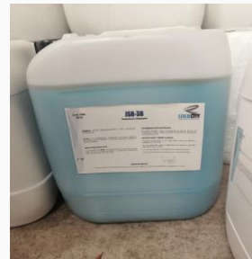
JSR-38 Deodorizante y disgregante

Puede ser utilizado en: Sector agropecuario (granjas avícolas, porcícolas, ganaderas), industrial e institucional.