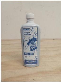
DMC-500 Detergente para ropa

Ingredientes activos: Tensoactivos, aroma, agua.