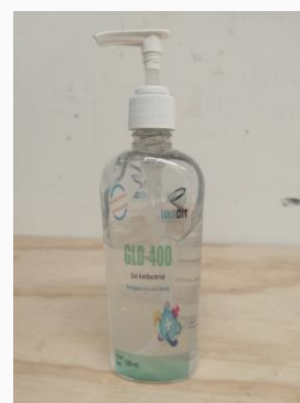
GDL-400 Gel antibacterial

Puede ser utilizado en: Plantas de alimentos, rastros, emparadoras, expendios, hospitales, hoteles, restaurantes, entre otros.