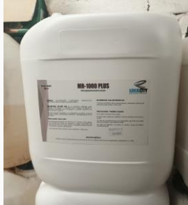
MR-1000 PLUS Desengrasante alcalino clorado

Ingredientes activos: Alcalinizantes, clorógenos tensoactivos aniónicos, surfactantes y emulsificantes.