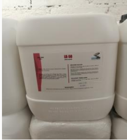
LK-50 Jabón corporal

Ingredientes activos: Texapón, cloruro de sodio, metil parabeno, emulsificantes.